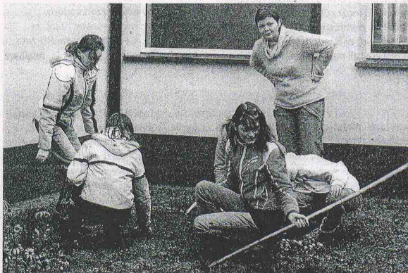
Wolontariusze z Gimnazjum nr 3 w Otwocku od wielu lat sadzą żonkile - symbole nadziei

Nauczmy się umierać, obcować ze śmiercią nie jako z ostatecznym wyrokiem, ale z refleksją, co pozostawimy po sobie. Horacjańskie "nie wszystkie umrą" i kamedulskie "memento mori - pamiętaj, że umrzesz", spróbujmy zrozumieć dla samych siebie, abyśmy mogli, gdy zapuka do nas śmierć, spokojnie otworzyć jej drzwi będąc przygotowanymi na daleką, nieznaną podróż.