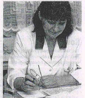
Brakuje nam wsparcia ze strony władz - mówi siostra oddziałowa otwocckiego hospicjum